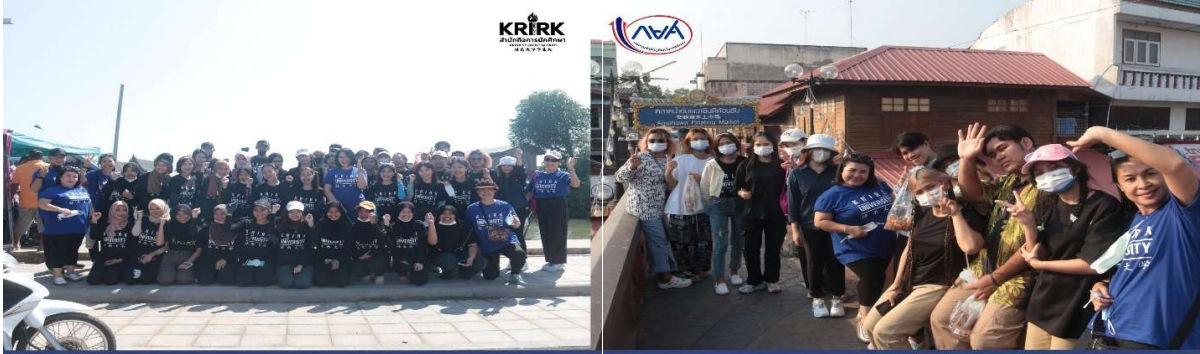
งานกองทุนกู้ยืมเพื่อการศึกษา สำนักกิจการนักศึกษา จัดโครงการ "ตันกล้าอาสาปลูกป่าชายเลน คืนสู่สิ่งแวดล้อม" ประจำปีการศึกษา 2565 ณ บ้านคลองโคก รีสอร์ทฯ จังหวัดสมุทรสงคราม